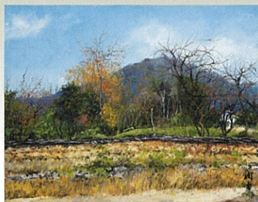
《古壁の秋》 [奈良県奈良市高畑町福井、奈良新薬師寺近く]1971年