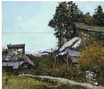
《比良春雪》 [京都府京都市左京区大原]1970年