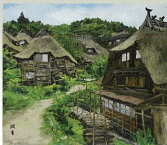
《山間草炎》 [山形県東田川郡朝日村田麦俣]1962年