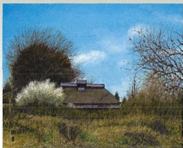
《春遊》 [埼玉県東松山市神戸]1988年