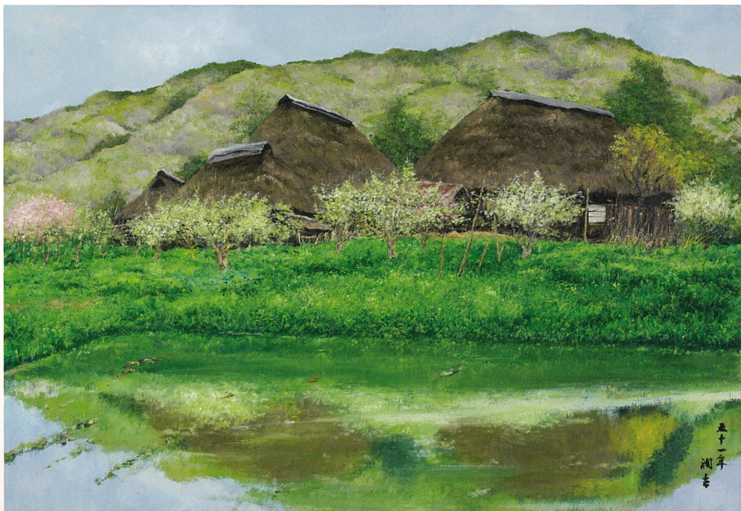
向井潤吉《春景》[岩手県上閉伊郡宮守村]1976年