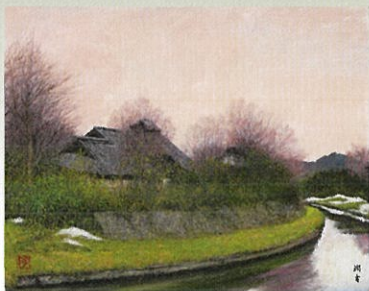
《春壩》 [埼玉県川越市郊外]1984年